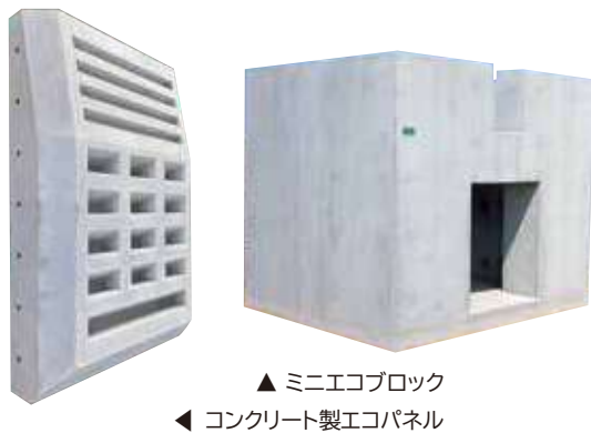
▲ ミニエコブロック ◀ コンクリート製エコパネル

また、夏場に鋼製パネルに比べ高温にならないコンクリート製エコパネルを、大阪湾フェニックスセンターの協力を得て泉大津沖処分場に設置し、生物生息調査を開始しました。