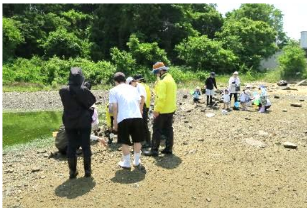
干潟での生物の採取