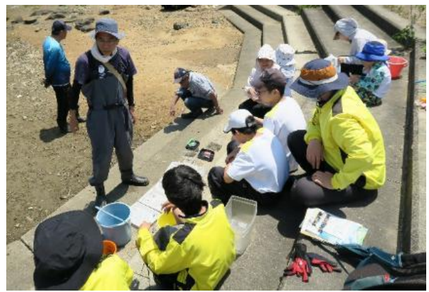
石田先生の解説と採取生物の同定