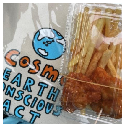
▲記念のエコバッグ、バイオマス食用油で揚げた唐揚げとポテト