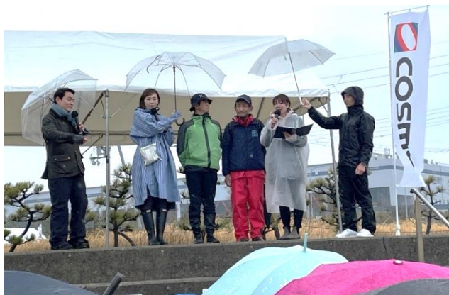
▲トークステージでCIFER・コアの活動を紹介