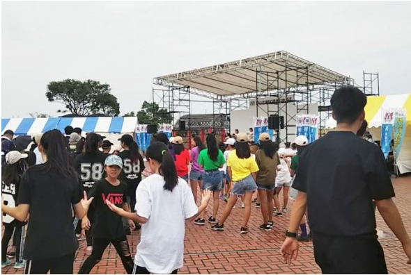
ステージイベント