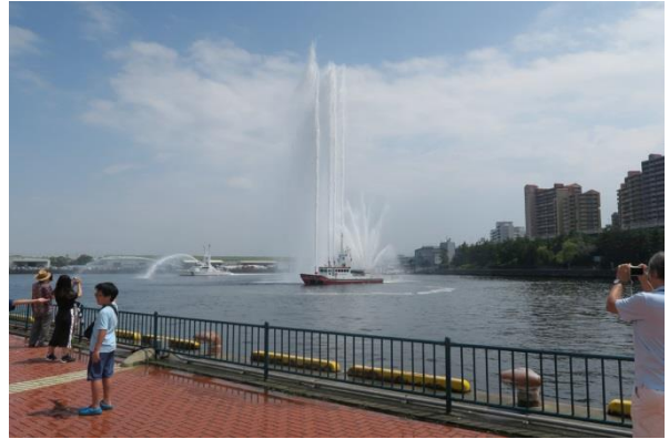
堺市消防局の消防艇によるパフォーマンス

CIFER・コアのブースで実施したアンケートには次のような感想が寄せられました。（回答数 138）