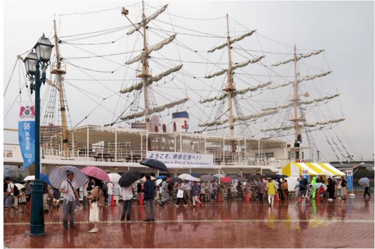
←記念式典の様子（写真左上） ↑日本丸クルーズ 企業・団体PRや飲食、物販のブース（写真左）