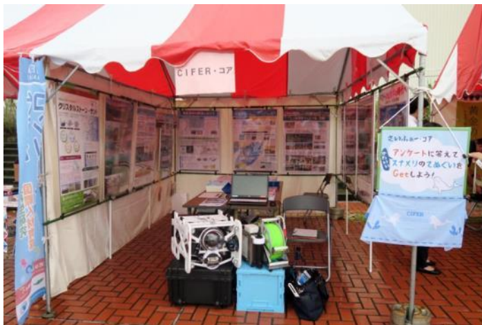
CIFER・コアの展示ブース

見学された方の中には、地元に住んでいても普段は港の方へ来ないという方も多く「大阪に住んでいると海のことには関心を持ちづらく、今まで知らないことばかりだった」と感想を漏らす方もおられました。今回の展示では、広く一般の方々に大阪湾での様々な取り組みについて関心を持っていただけたことが何よりの収穫であったと思います。