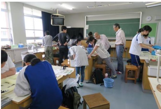
▲ 干潟での観察後、採取した生き物の同定を行った。