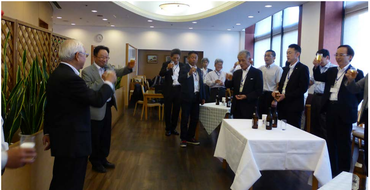
懇親会（平成 27 年 5 月 29 日 堺商工会議所内）