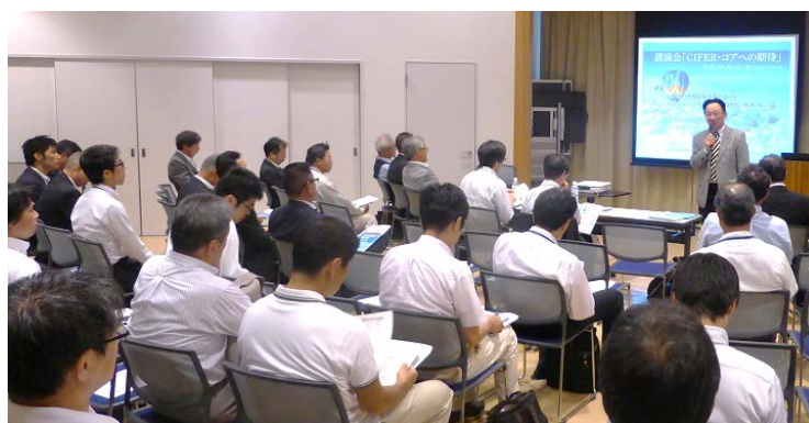
平成 27 年 5 月 29 日 S-CUBE にて