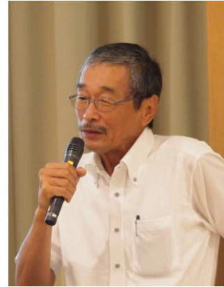
大阪市立自然史博物館 山西館長